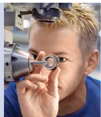
Voith Industrial Services